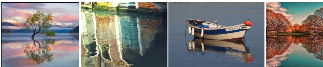
Photographies sites internet

En envoyant ces photos vous autorisez la communication de Roinville à les utiliser pour un usage interne (Exposition et Roinville Infos) et à des fins non commerciales exclusivement.