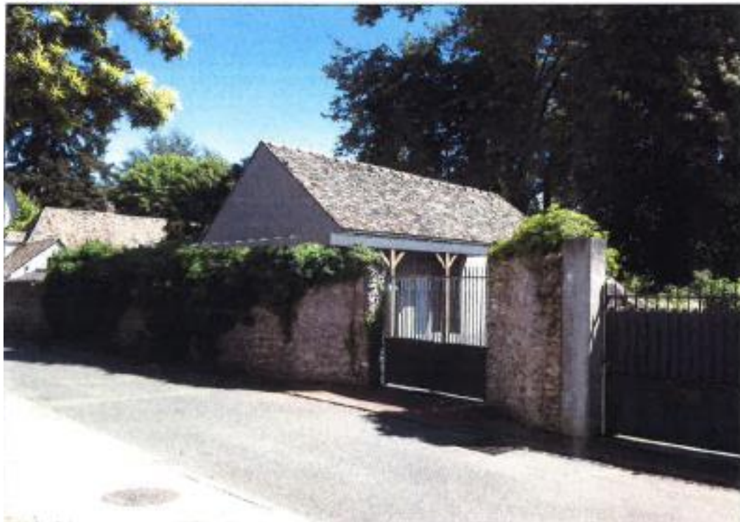
Insertion du projet dans le site.